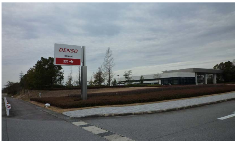
デンソー善明製作所 160112